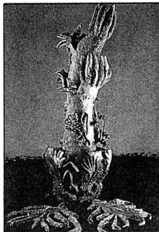
Sana Musasamas eruptive tropekst.